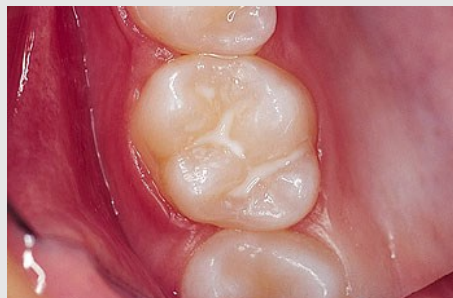
Schutz vor Karies: Versiegelung der feinen Grübchen auf der Kaufläche

Bei der Versiegelung werden die Fissuren mit einem hellen Kunststoff dauerhaft verschlossen, so dass an diesen Stellen keine Karies mehr entstehen kann (siehe Abb. unten).