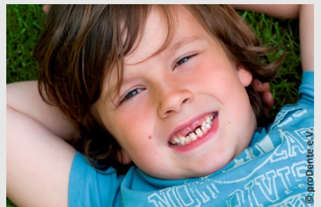
Bei der Prophylaxe lernen Ihre Kinder die richtige Zahnpflege

Es gibt also keinen Grund, warum Sie auf Prophylaxe für Ihre Kinder verzichten sollten.